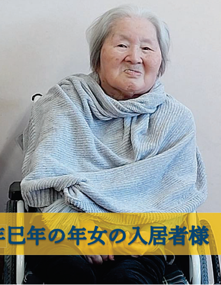
今年巳年の年女の入居者様