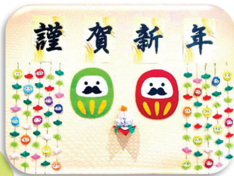
玄関に飾った迎春用のだるま作品

地域交流スペースパティオでは、毎月季節ごとのテーマを決めて、地域の皆様と作品を作っています。