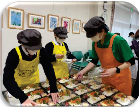
ボランティア中の高校生(左の二人)

毎月一回実施している「子ども地域食堂パティオ」や「パティオで勉強やっちゃおう(学習支援)」に、東稜高校生が毎回数名ずつボランティアで参加してくださっています。