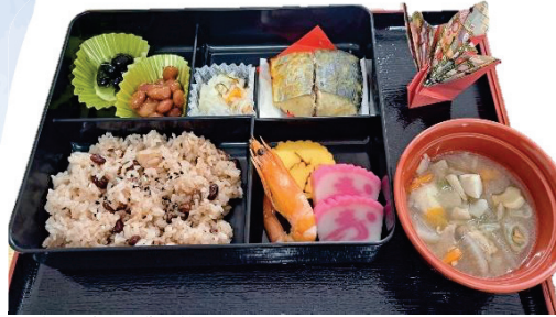
【新春祝い御膳メニュー】