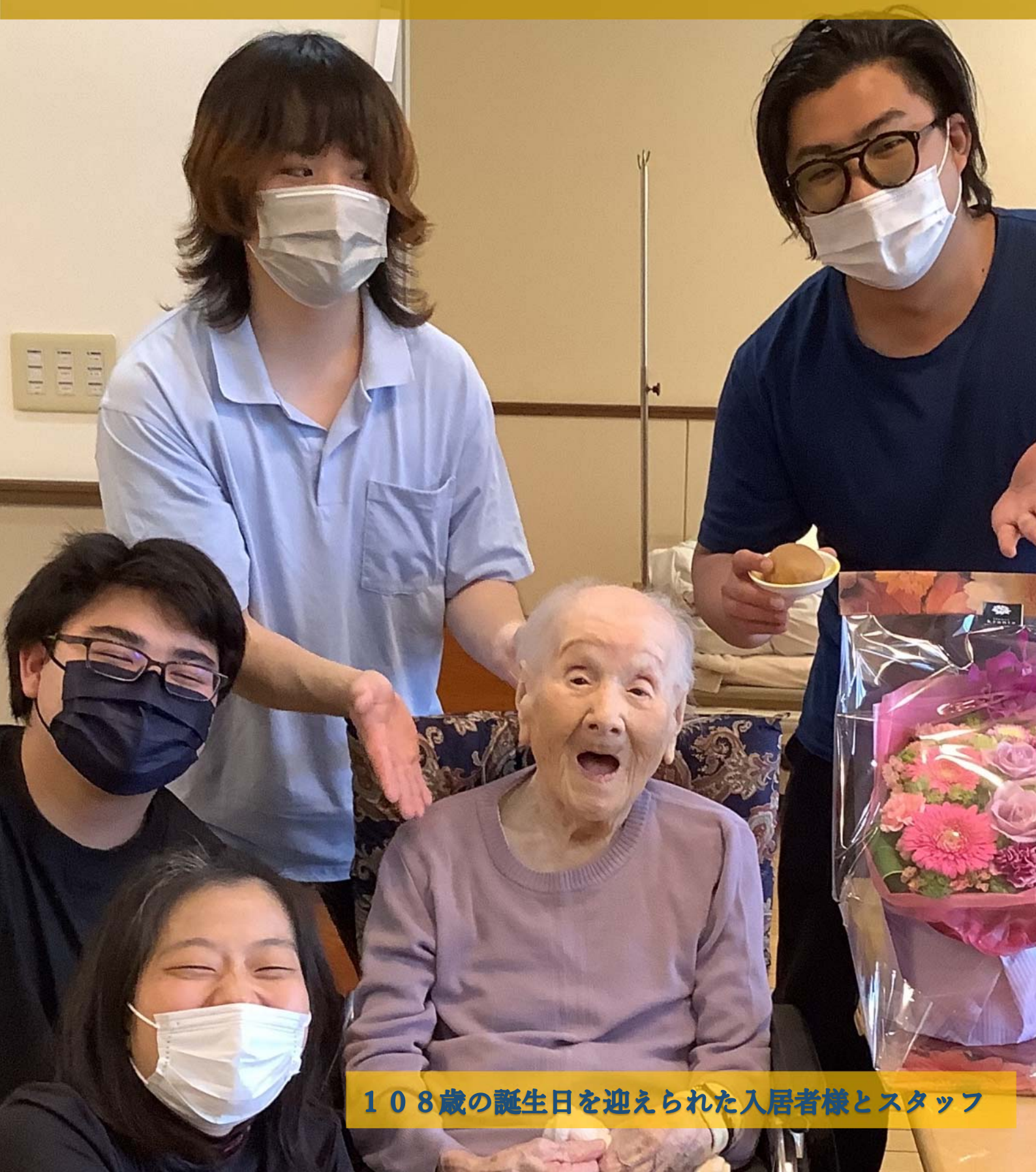
108歳の誕生日を迎えられた入居者様とスタッフ