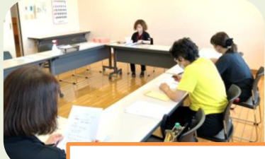
ヘルパー勉強会の様子

利用者様宅へ訪問し日常生活上で困っておられる所の支援をすることで、自分の家で少しでも自分らしく、生き生きと生活されるお手伝いをする仕事です。